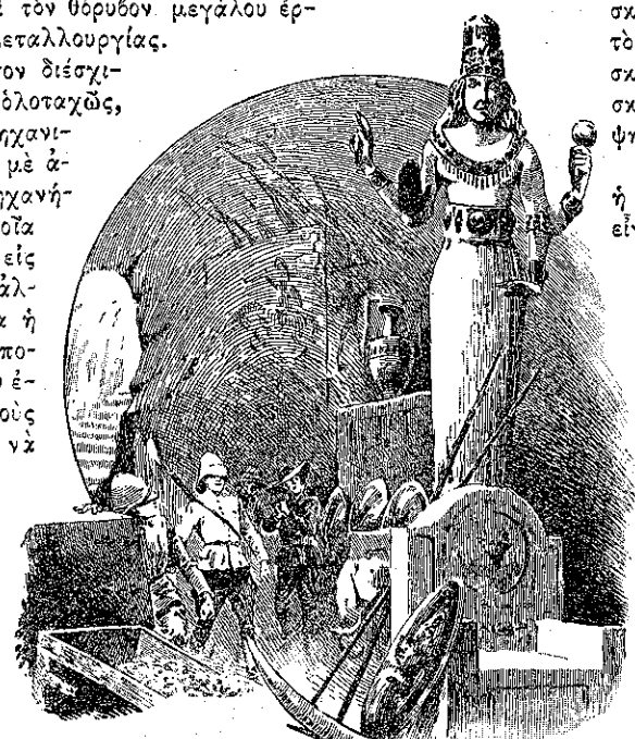
«Ἐἶνε σὰν ὄνειρο...» (Σελ. 340, στ. γ'.)