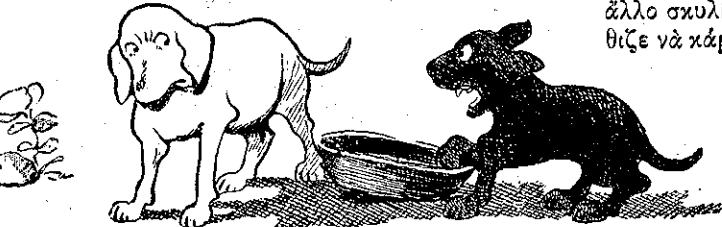
«Ἐπρεπε πρῶτος αὐτὸς νὰ χάψῃ...» (Σελ. 340, στ. γ'.)

«Θὰ γίνῃ περίφημο λαγωνικό, ἀν μοιάσῃ τῆς μητέρας του», — ἔλεγε ὁ